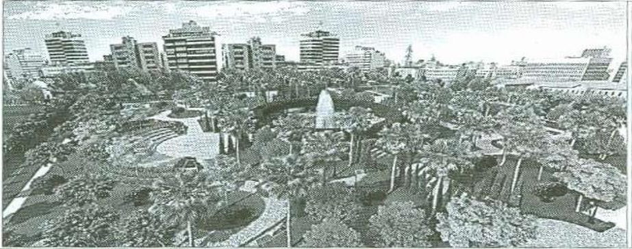
مجسم لحديقة الصنائع